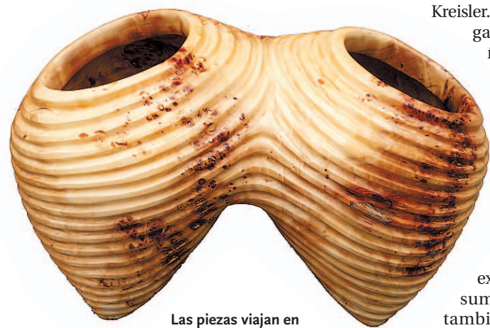
Las piezas viajan en estos momentos a París y se subastarán el 23 de junio.

mocionarlas en París y venderlas a través de su casa de subastas en Francia. Las piezas viajan en estos momentos al país gallo y la subasta está cerrada para el 23 de junio.