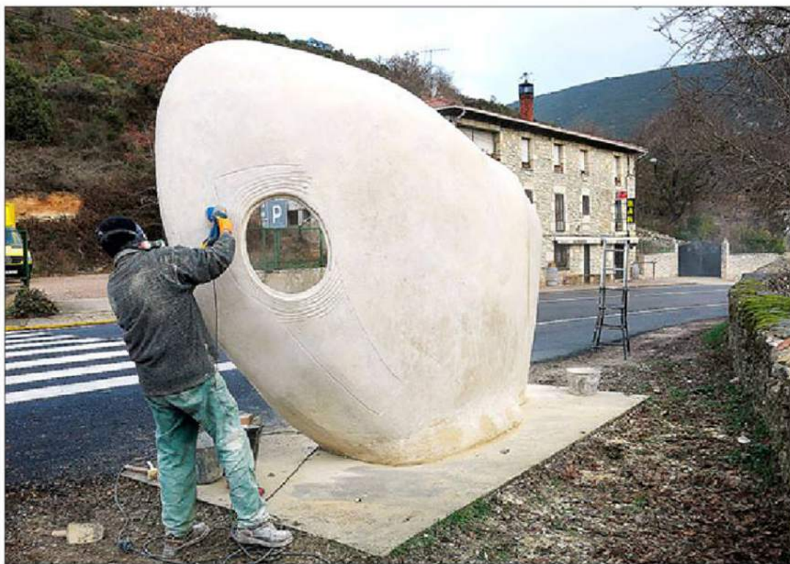
Armiño realizando los últimos remates en la parte trasera de la pieza.