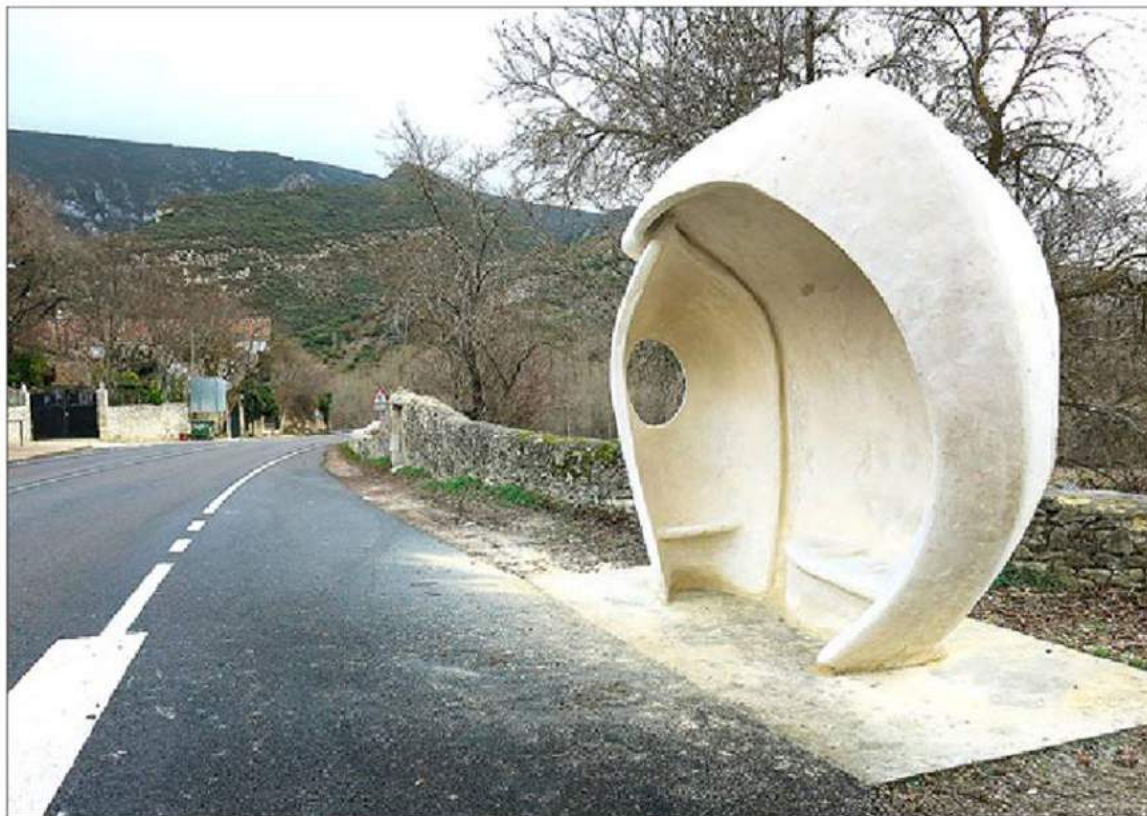
La marquesina de hormigón armado creada por Carlos Armiño recién acabada.

LA DIFICULTAD. A su juicio, «la escultura aplicada es mucho más difícil que la artística, donde solo te preocupas de lo estético y el equilibrio». Pero la marquesina