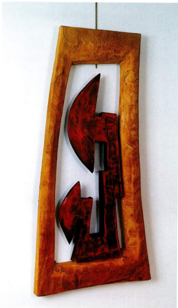
Escudo Africano 2 Escultura en madera