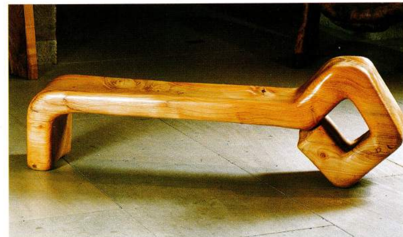
Siesta Escultura en madera