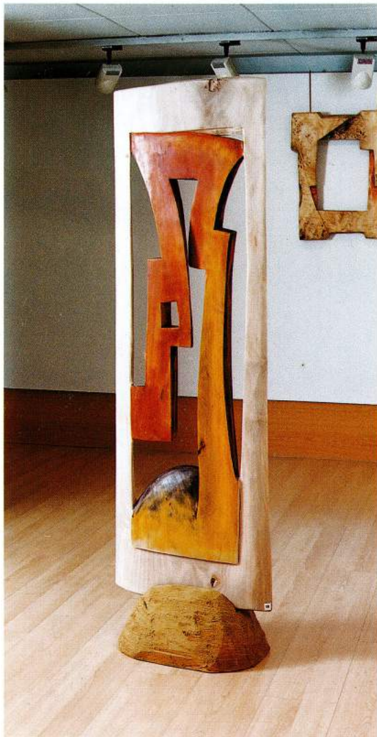
Escudo Africano Escultura en madera