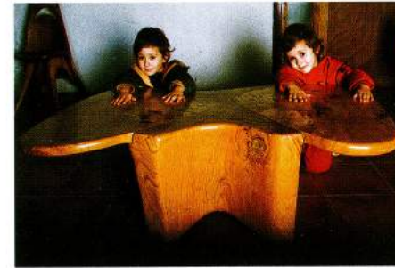
Mesa mariposa Escultura en madera